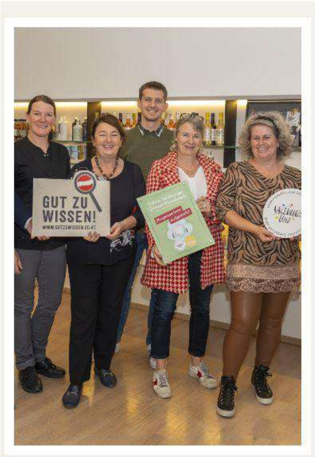
frauenanderskompetent Salzburg, Salzburg