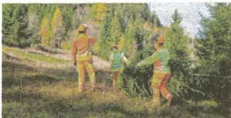
Auszubildende des Campus Oberrain bei der Christbaumernte.