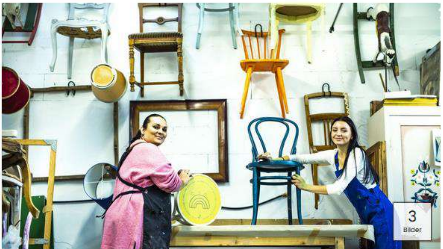
SÖB: "Funkelnaget" eine Upcycling-Werkstatt. Hier können Frauen, bis zu einem Jahr, angestellt werden.